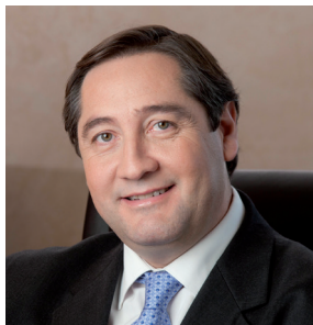
Josep Maria Pelegrí i Aixut Conseller d'Agricultura, Ramaderia, Pesca, Alimentació i Medi Natural

Catalunya és un territori industrial i turístic, però també és una potència agrícola, ramadera i alimentària, amb una gran implantació de la indústria d'elaborats . El sector agroalimentari català representa el 10,3% de les empreses catalanes, el 16,3% de l'ocupació i el 15% del volum brut de negoci. És la més important de l'Estat, amb un 23,3% del volum de negoci estatal, i és el segon clúster agroalimentari d'Europa.